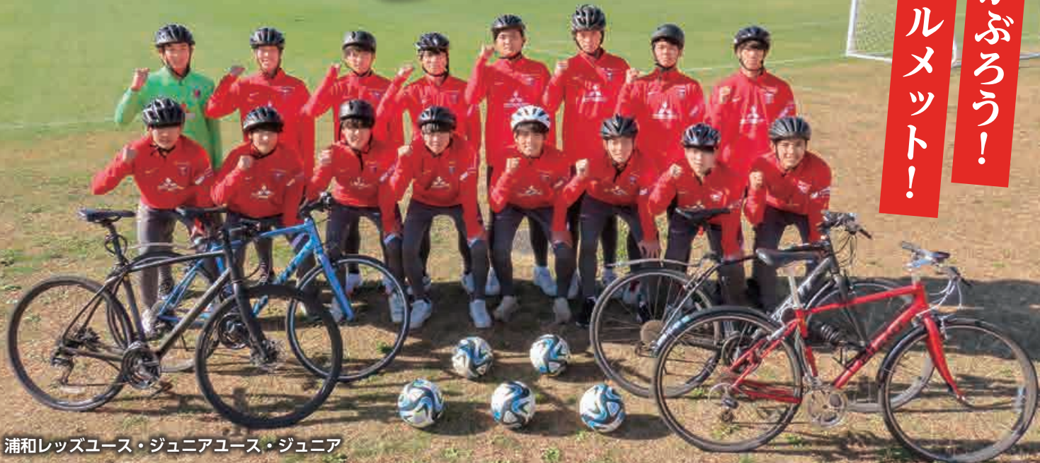
浦和レッズユース・ジュニアユース・ジュニア